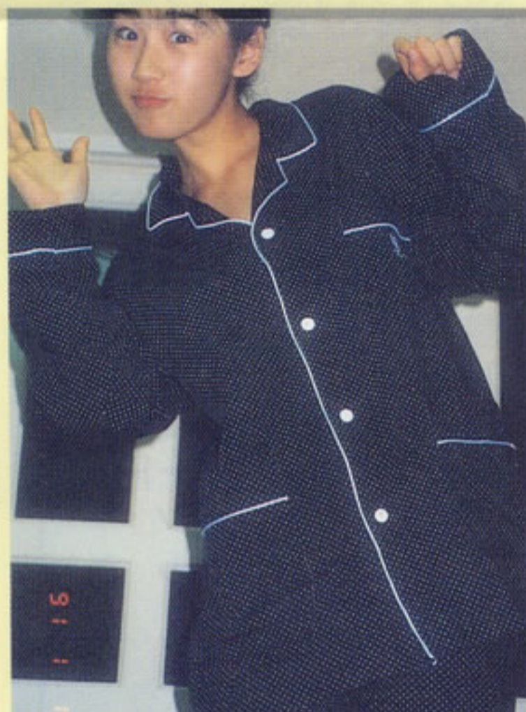
お母さんや お父さんにたつぷり甘えてき ちゃったみたいだよ！