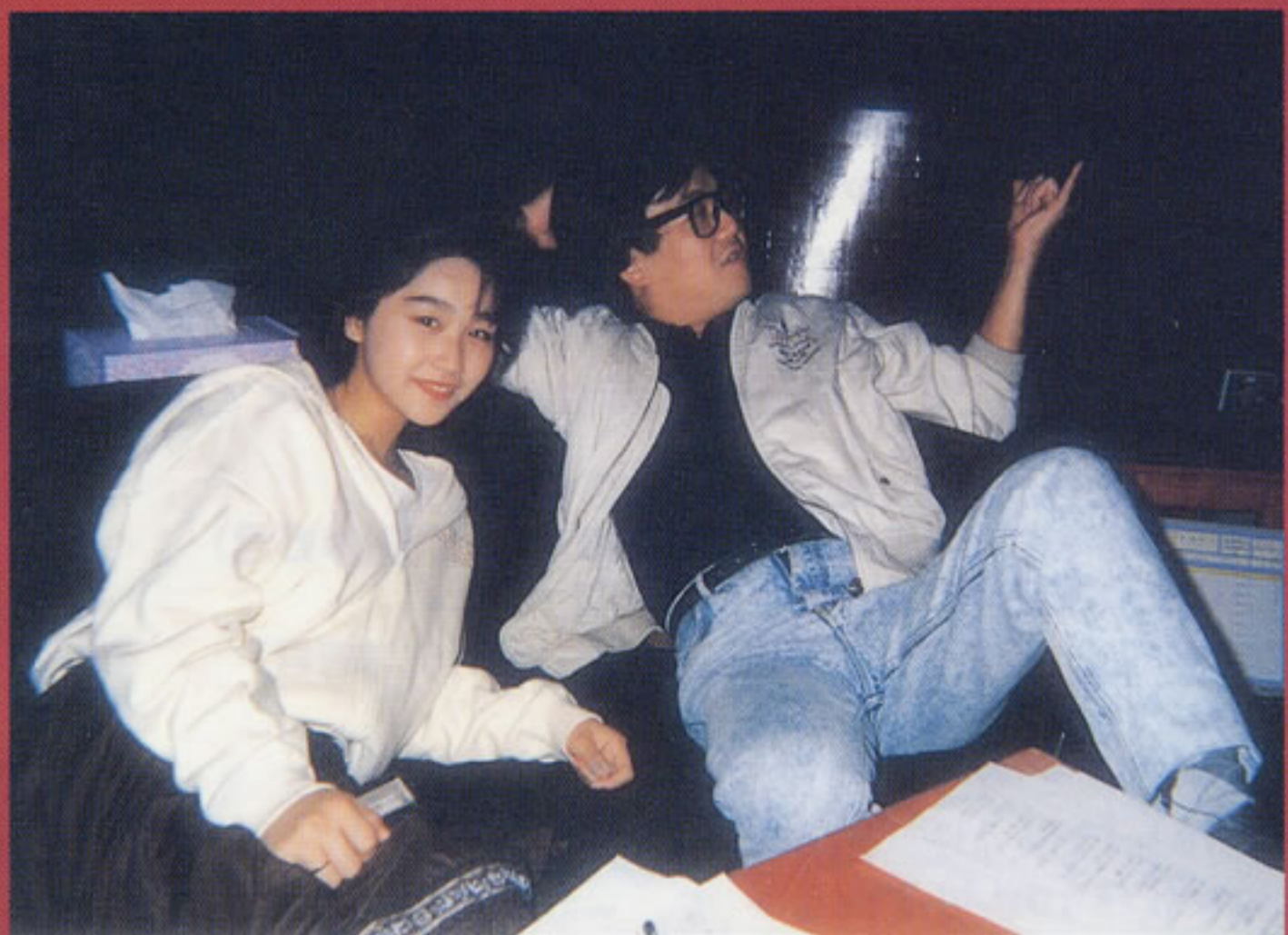
「プロ-グ」の中は、 「プロ-グ」という曲が入っています。