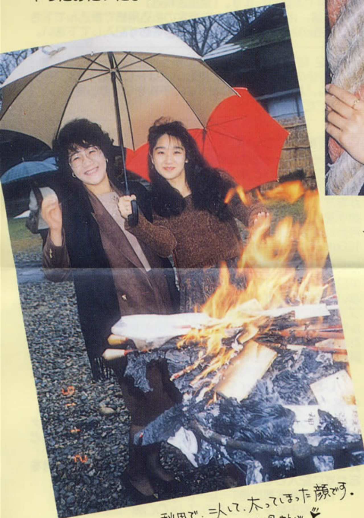
秋田で、お母さんや お父さんにたつぷり甘えてき ちゃったみたいだよ！

お正月のお休みは実家へ帰った純ちゃん。 お母さんやお父さんにたつぷり甘えてき ちゃったみたいだよ！