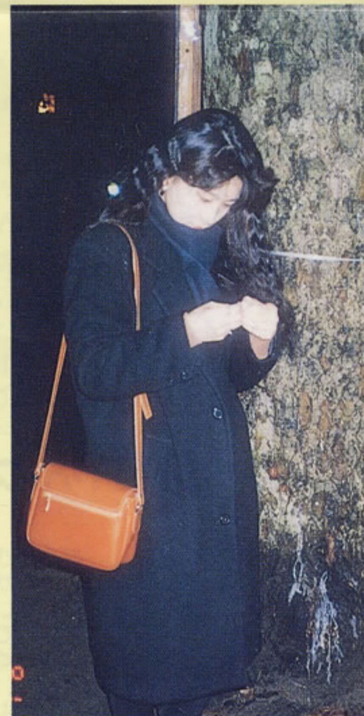
お母さんや お父さんにたつぷり甘えてき ちゃったみたいだよ！