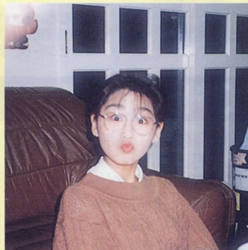
12月31日の顔です。 夕食は…… たっぷり甘えてき ちゃったみたいだよ！