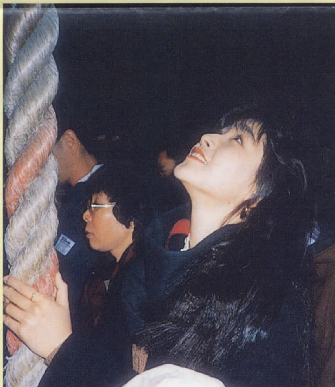
お母さんや お父さんにたつぷり甘えてき ちゃったみたいだよ！